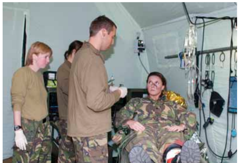
linksboven Hospitaaltentensysteem 'De Polyvalente Onderkomens' (POON) moet op termijn de vertrouwde boogtenten vervangen. Groot voordeel van deze tent is dat hij naast verwarmd ook gekoeld kan worden. Verder is hij vervaardigd van licht materiaal en dus eenvoudig te vervoeren. Tijdens Medic Diamond werden deze nieuwe tenten voor het eerste gecombineerd met MOGOS (mobiel hospitaal van aaneengeschakelde containers en tenten). linksonder Na het ontvangen van de nine-liner spoedt de Chinook zich naar de vooruitgeschoven hulptop, waar de gewonden zo goed mogelijk gestabiliseerd zijn. Met een ziekenwagen worden de gewonden naar de helikopter gereden, ingeladen en weggevoerd naar het Role 2 ziekenhuis achter de linies.

400 GNK houdt grootste ketenoefening in jaren